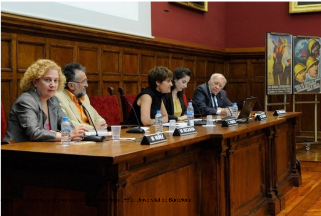
Imatge de la presentació del portal de recerca, la setmana passada a Barcelona.

Anomenat Sidbrint, el portal de recerca liderat per la UB pretén recuperar la memòria íntegra de les Brigades Internacionals